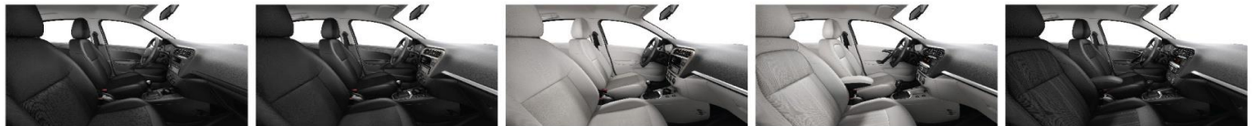
Ткань черная Isar Mistral (Access)