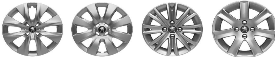
Стальные диски 15" с колпаками Bore (Access)